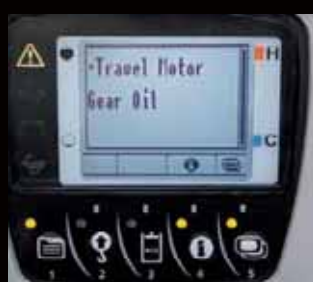
Service interval informatie