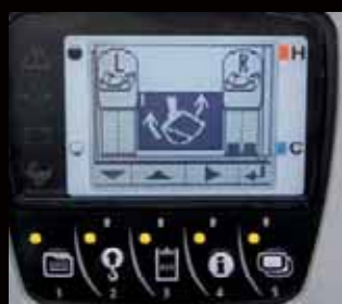
Max. oliestroom extra functie (SP1 en SP2)