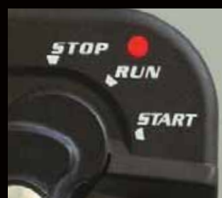
Anti diefstal immobilizer activatie LED alarm