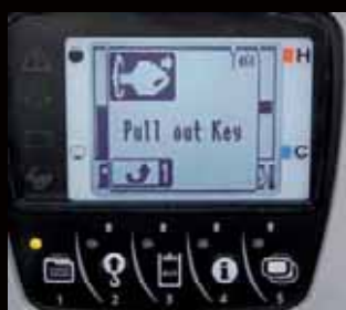
Verwijder contactsleutel alarm